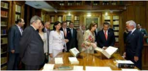
Imagen de los interiores de la Real Academia de La Lengua.

Y es que Gabo podía decir o escribir groserías, pero nunca fue vulgar, y esa diferencia es muy importante de reconocer.