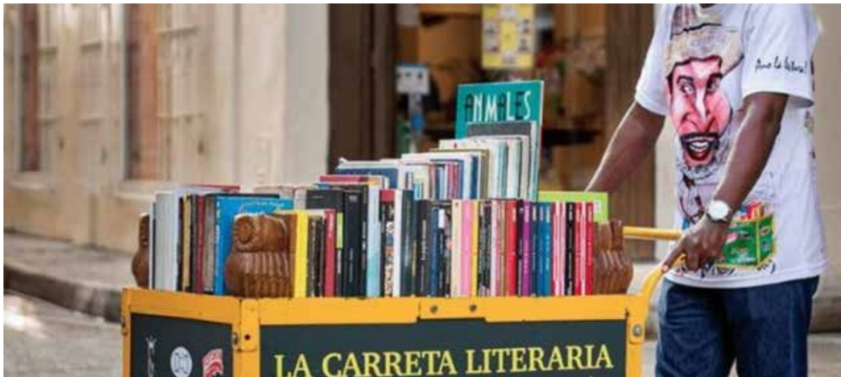
La carreta literaria en https://lacarretaliteraria.com/