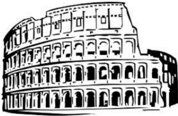
Perfil del Coliseo.

El escritor colombiano, aprovechando su estancia en Ginebra como corresponsal, se traslada a Roma en 1955, donde decide matricularse en el Centro Experimental de Cinematografía. Pionero, Gabo ya había escrito sobre cine en El Espectador, fue el primer columnista de cine del periodismo de su país. Además, contaba en su haber, con la película La langosta azul, de la que él fue uno de los directores.