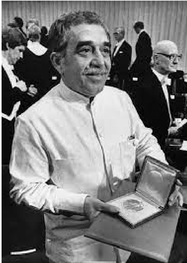
Gabriel García Márquez recibe el nobel.