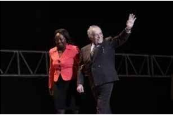
Gabo en el 2009.

Pensar y crear sobre el papel, nos remite a concebir la escritura como instrumento epistémico y artístico, vinculado con a la vez con el conocimiento y la imaginación.