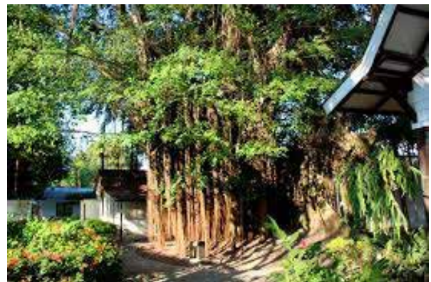
Árbol en la casa natal de Aracataca.