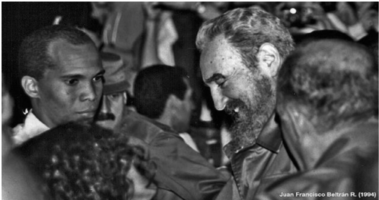
Foto del líder cubano tomada por Juan Francisco Bernal. Fuente: Wikimedia Commons

Imagen de un café en París. Fuente: Flickr.