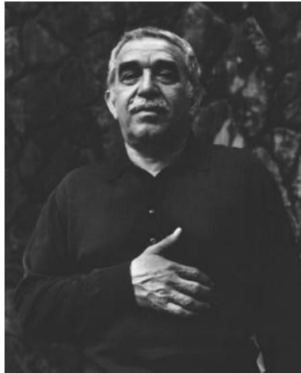
García Márquez en su casa de México.

En el marco de la Cátedra Gabriel García Márquez 2021, que dio a luz este documento, la Secretaría de Educación de Bogotá, en particular la Dirección de Educación Preescolar y Básica, y la Universidad Nacional de Colombia (Grupo de investigación Cognición y Lenguaje en la infancia) llegamos a la feliz conclusión que las reflexiones sobre educación de García Márquez no fueron una aventura solitaria como él las llamaría, que los docentes de la ciudad de Bogotá lo acompañarán siempre y que el aporte que trataremos de poner de relieve en estas páginas, para el aprendizaje de miles de niños de la ciudad que lo acogiera como estudiante en los años 40, s, es inconmensurable. Esperamos sea de su disfrute y provecho.