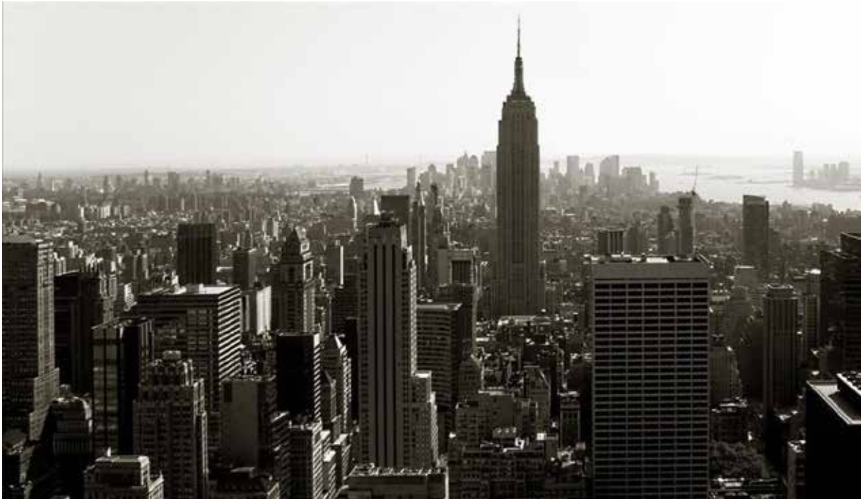
Postal de Manhattan.