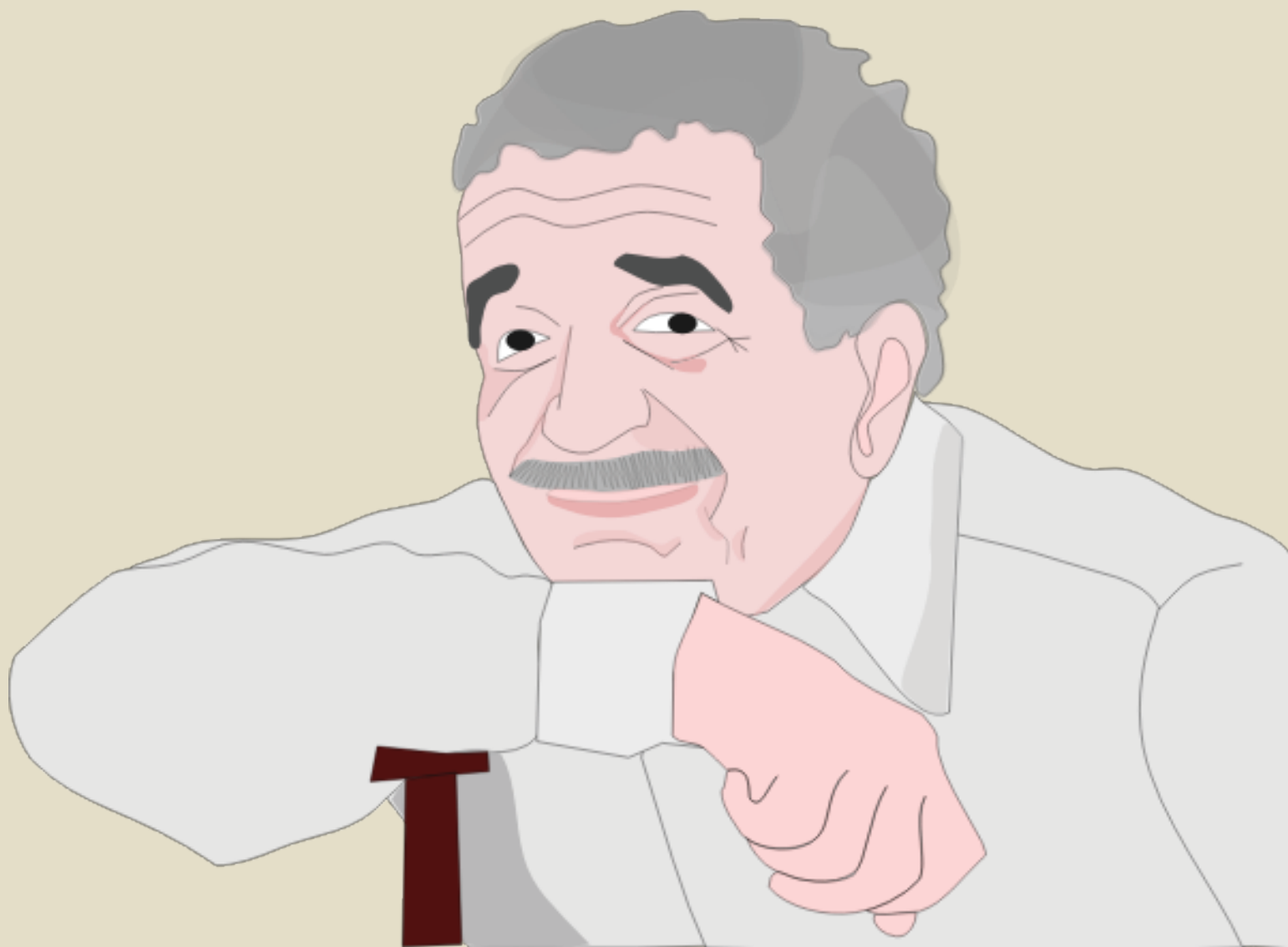
Ilustración de Gabriel García Márquez