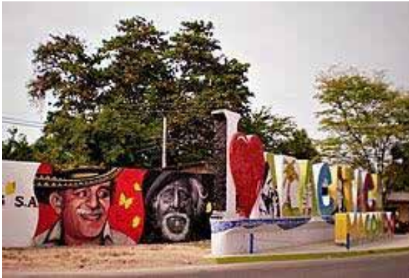
Entrada de Aracataca.

trascendentales que marcarían posteriormente su vida y en su trabajo: la Guerra de los Mil Días, en la que su abuelo había sido coronel, y la masacre de los trabajadores en huelga de la United Fruit Company en Ciénaga por parte del Ejército colombiano en diciembre de 1928, conocida como la Masacre de las Bananeras. Los dos eventos se volverían neurálgicos en su producción literaria y su carrera como escritor.