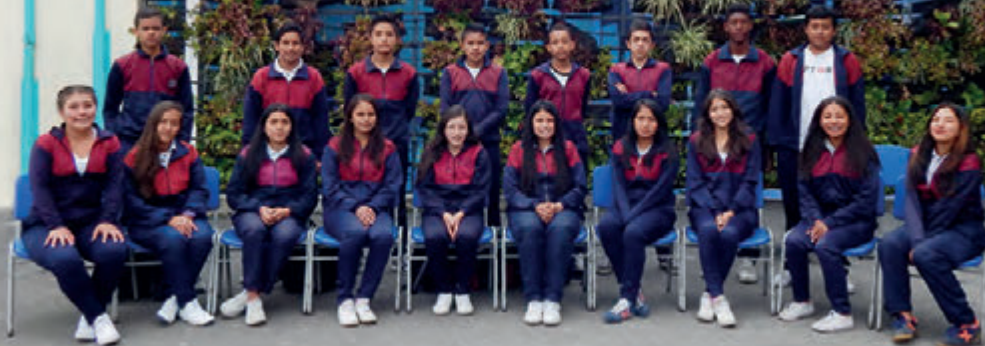
Sede A Grado 1001