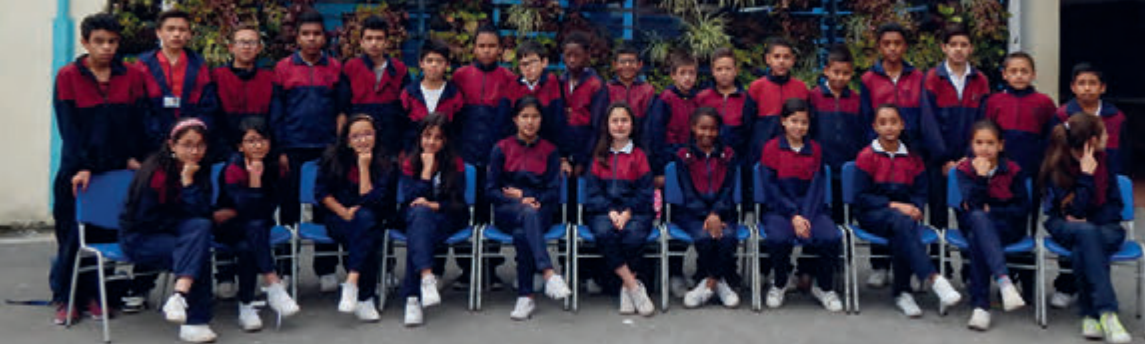
Sede A Grado 603